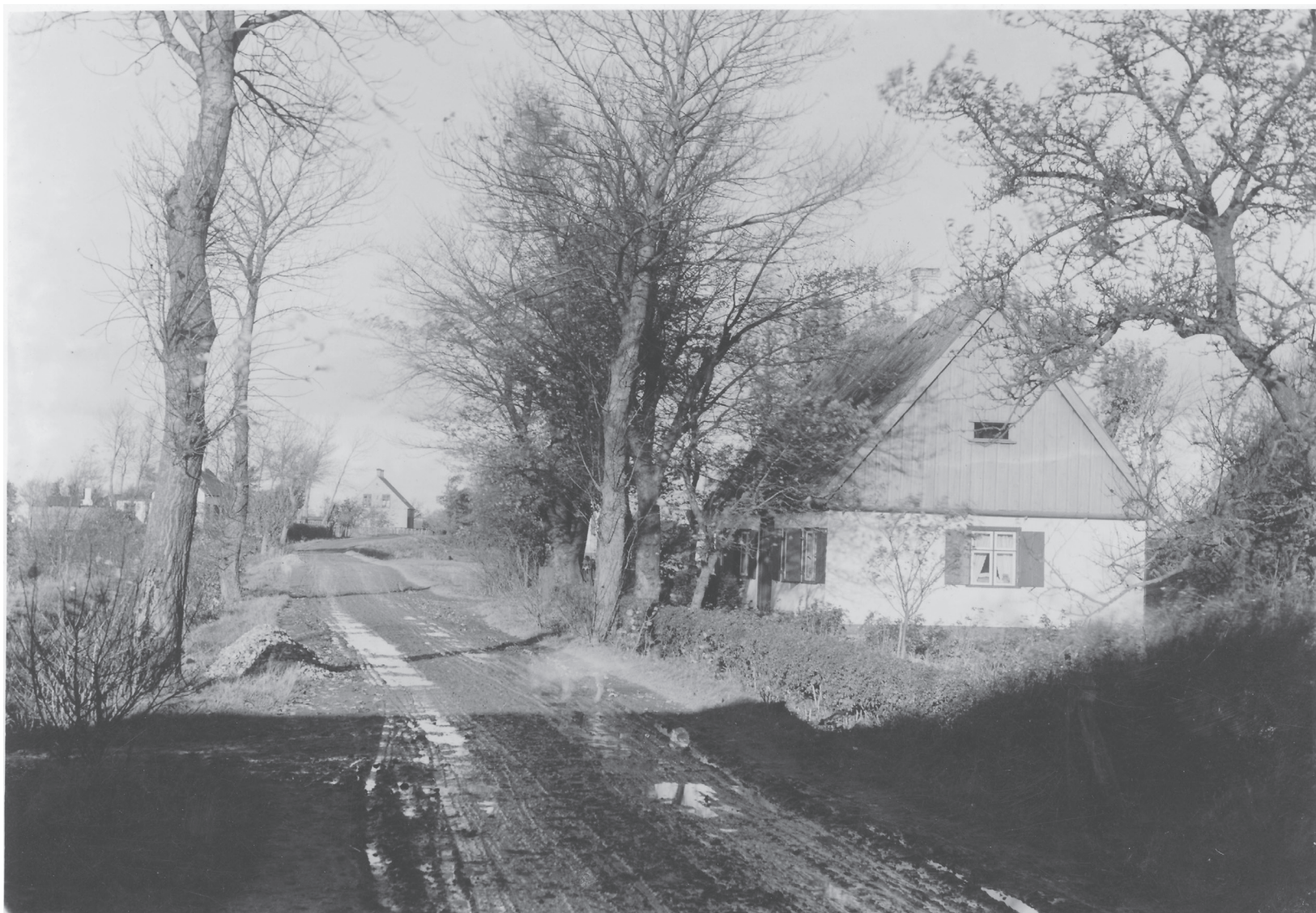
Hvidovrevej (fra starten af 1900-tallet)