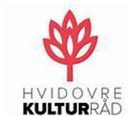
Logo for Hvidovre Kulturråd.

Aftenen sluttede med, at mange tilhørere fortalte om deres forhåbninger til det frivillige kulturlivs fremtid.