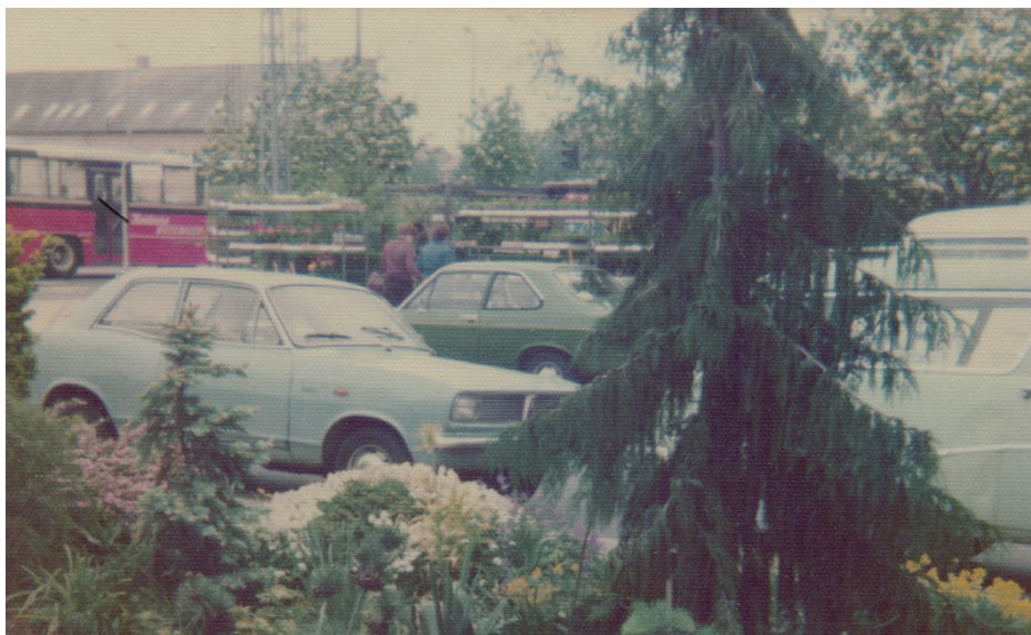
Travlhed med Kunder i butikken. Bemærk Bus 133 samt fabrikkerne i baggrunden. Foto er taget ca. 1975 af Elly Petersen.

Disse stensætninger der bl.a. blev bygget op om f.eks. fiskebassiner gik vel også en del af mode.