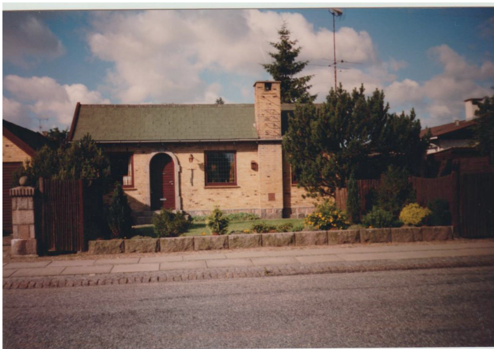
Femagervej 45, 1990. Huset har grønmalet skifereternit. Til venstre den ene af de to granitstøtter, der danner indkørsel. Til højre bag træet lå stenhuggerværkstedet i en lille tilbygning.