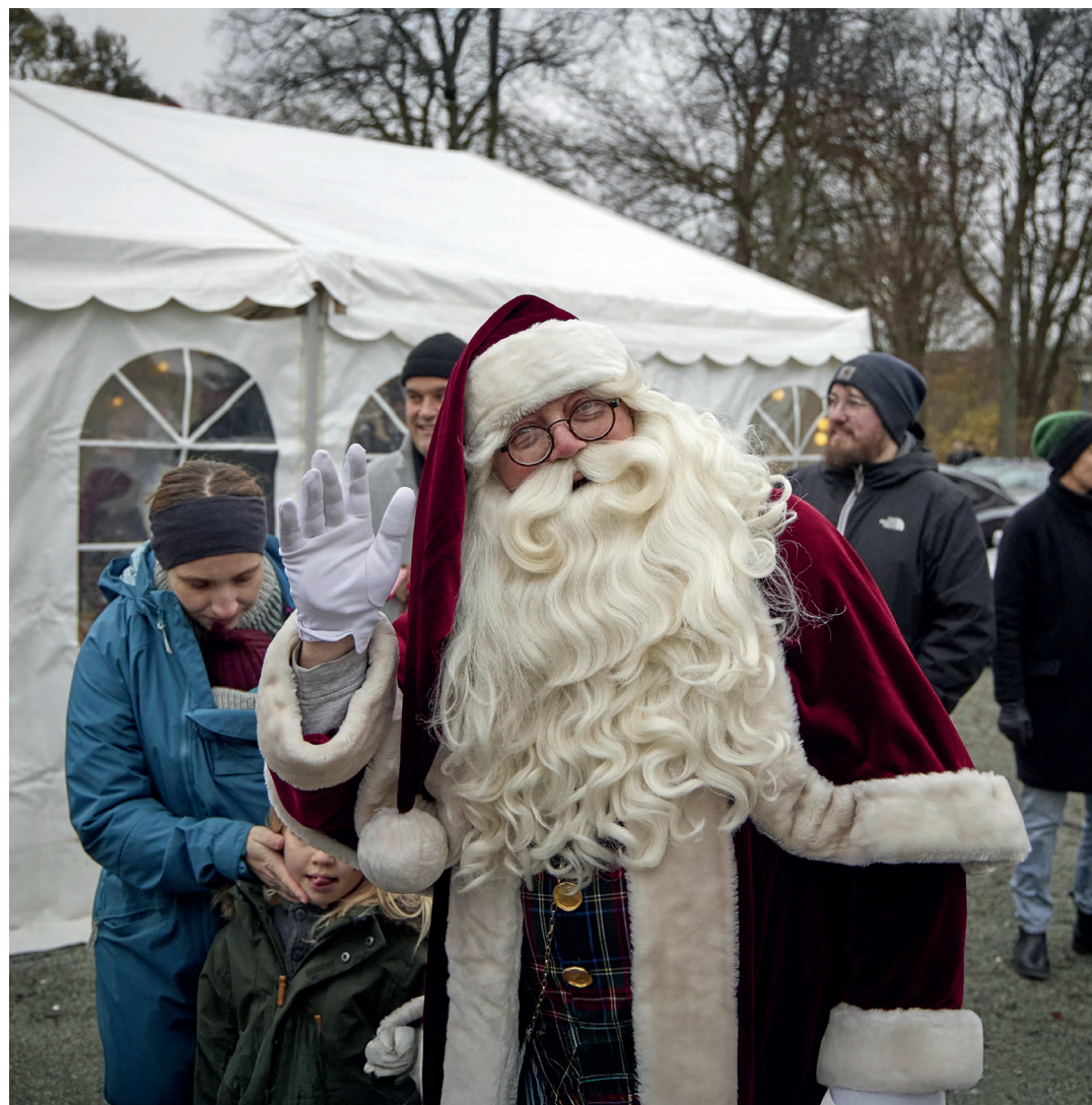
Fra julemarkedet

Markedet åbner kl. 10 og slutter kl. 15. Det fulde program kan du se på www.cirkusmuseet.dk . Markedet er som de sidste 18 år arrangeret af Cirkusmuseet og Forstadsmuseet med støtte fra Hvidovre Kommune og i år også SparNord og Hyundai Hvidovre, som du også vil kunne finde på markedet.