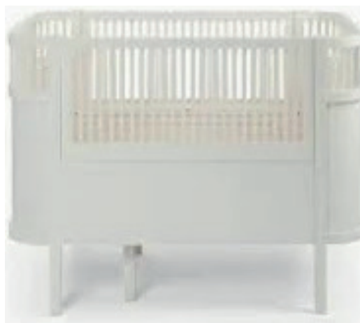
Sådan en udtræks seng – JUNO- seng stod i rigtig mange hjem i min barndom.