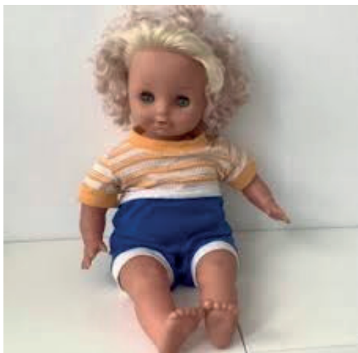
Sådan en Rosenbud-dukke havde jeg. Den var meget populær i min barndom

Jeg havde også Rosebud-dukke. Det var de første dukker med hår, der kunne friseres, vaskes og krølles. De kunne fås både lyshåret og mørkhåret. Og så kunne man få alt muligt tøj til dem. Jeg fik også en ”negerdukke”, da min mor syntes, at jeg skulle have en brun dukke. Disse dukker var det helt store hit hos mine veninder. Vi gik rundt og besøgte hinandens dukker.