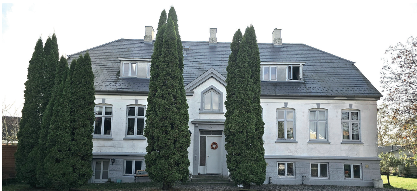
Skelgården 2024