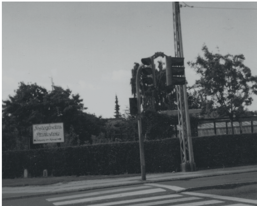
Reklameskiltet til ”Toftegårdens Planteskole” set fra Arnold Nielsens Boulevard.

På Københavns Hovedbanegård var der opstillet et par telefonbokse, og ved siden af disse, var der to bokse med stol, et bord og på det en skrivemaskine. Den kunne man leje for en timepris. Jeg, der aldrig havde været i nærheden af en sådan, blev sat på opgaven. Dengang brugte man ikke det med at tage kopier. Nej, man skrev på den originale side og med gennemslag til sort karbonpapir og meget tyndt pergamentpapir. Disse gennemslag, var parvis sat sammen, så man kunne skrive op til ca. 5 ”kopier” ad gangen, hvis man trykkede godt til. Det upraktiske ved dette var, at ved f.eks. slåfejl skulle der viskes ud på alle 5 ark, for derefter at kunne fortsætte skriveriet. Jeg ”øvede” mig flere dage i træk, og det var her jeg lærte to-finger systemet at kende. Den ene finger pegede, medens den anden trykkede tasten ned. Det var ikke spor sjovt, og så med alle de latinske navne på planterne. Ramte man to taster på en gang, så ”hang” tal/bogstav ”armene” sammen på vej op til papiret.