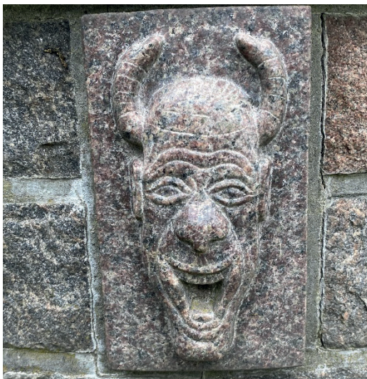
Hoved på ønskebrønd, Femagervej 45, udført af stenhugger Stanley Pedersen. Der løb oprindeligt vand ud af figurens mund. Juli 2024.