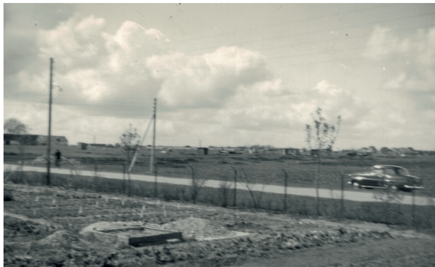
Et kig fra grunden mod gården Krogholtbjerg, hvor jeg hentede gødningen, som jeg gravede ned i Planteskolegrunden.

afvejet og bundtet, og jeg afleverede det til HB mandag morgen, på vej til skole. Om fredagen, var far så nede og afregne for sagerne.